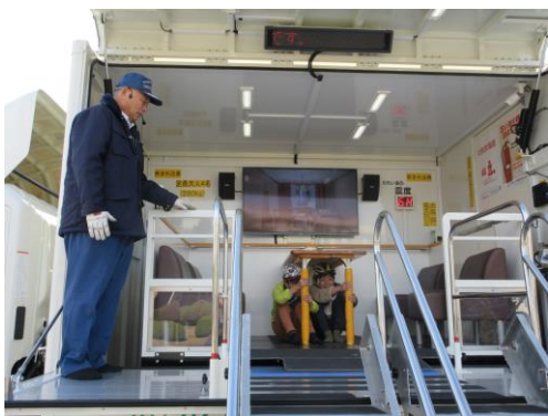
第2回 校内防災訓練 起震車体験