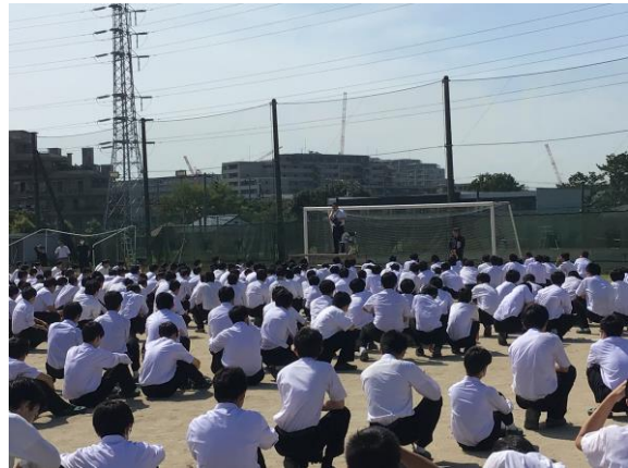
第 1 回 校内防災訓練