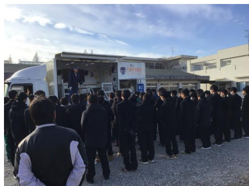
第 2 回 校内防災訓練 起震車体験