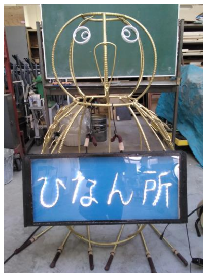
機械科 課題研究作品