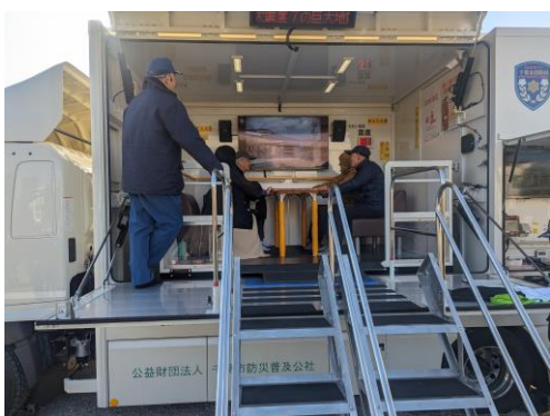
第2回 校内防災訓練 起震車体験