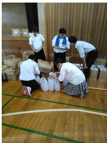
避難所合同防災訓練